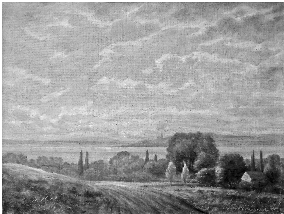
Füred a Tamás-hegyről (2)